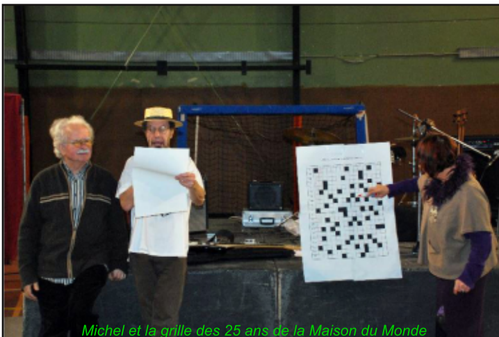
Michel et la grille des 25 ans de la Maison du Monde

SOLUTION DE LA GRILLE N°150 "LA CORRUPTION" page 11